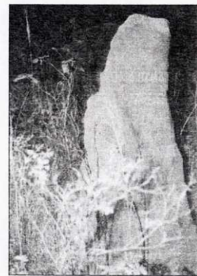
Kamień nagrobny na cmentarzu w Studziance

Na Podlasiu Tatarzy trafili w XVII wieku za sprawą Jana Sobieskiego i od tej chwili na stałe związali się z tym regionem. Centralnym punktem ich osadnictwa była Studzianka. W 1827 roku wieś składała się z 42 folwarków, w których gospodarowało 282 Tatarów. W drewnianym meczecie regularnie odbywały się nabożeństwa. Wieś rozrastała się szybko. Przybywało dworaków. Tatarzy, korzystając z urodzajnej ziemi i pięknych sadów, zdobywali spore majątki. Jednak uprawa roli nigdy nie przysłoniła im ich prawdziwego powołania - byli przede wszystkim żołnierzami. Potwierdzili to, uczestnicząc w powstaniu styczniowym. Za udział w walkach rodziny tatarskie były represjonowane przez Rosjan. Powszechne stały się zrywki na Sybir. Tatarom zabroniono używać języka polskiego, a na ich wieś nałożono wysokie kontrybucje. Ponieważ nie podporządkowali się carskim nakazom, rząd nasilił represje.