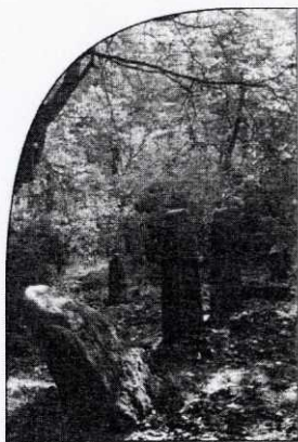
Mizar w kolonii Zastawsk (dawniej Ulanowszczyzna)